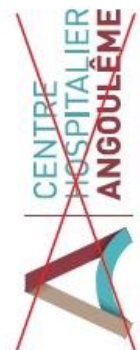
Orientation du logo