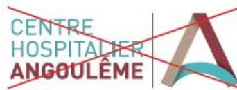
Déplacement d'éléments du logo